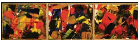
« Transparences et opacités » peinture sur toile 2014

Heures d'ouverture du mardi au dimanche de 13h à 16h30 en soirée vendredi et samedi de 18h30 à 20h30