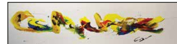
« Rencontres fluviales » peinture sur toile 2014

Heures d'ouverture Lundi au mercredi de 9h30 à 17h30 Jeudi et vendredi de 9h30 à 21h Samedi de 12h à 17h et lors des spectacles