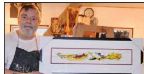
« Rencontres fluviales » peinture sur papier 2014

Heures d'ouverture Lundi et vendredi de 13h à 17h30 Mardi, mercredi, jeudi de 13h à 20h30 Samedi de 10h à 17h Dimanche de 12h à 17h